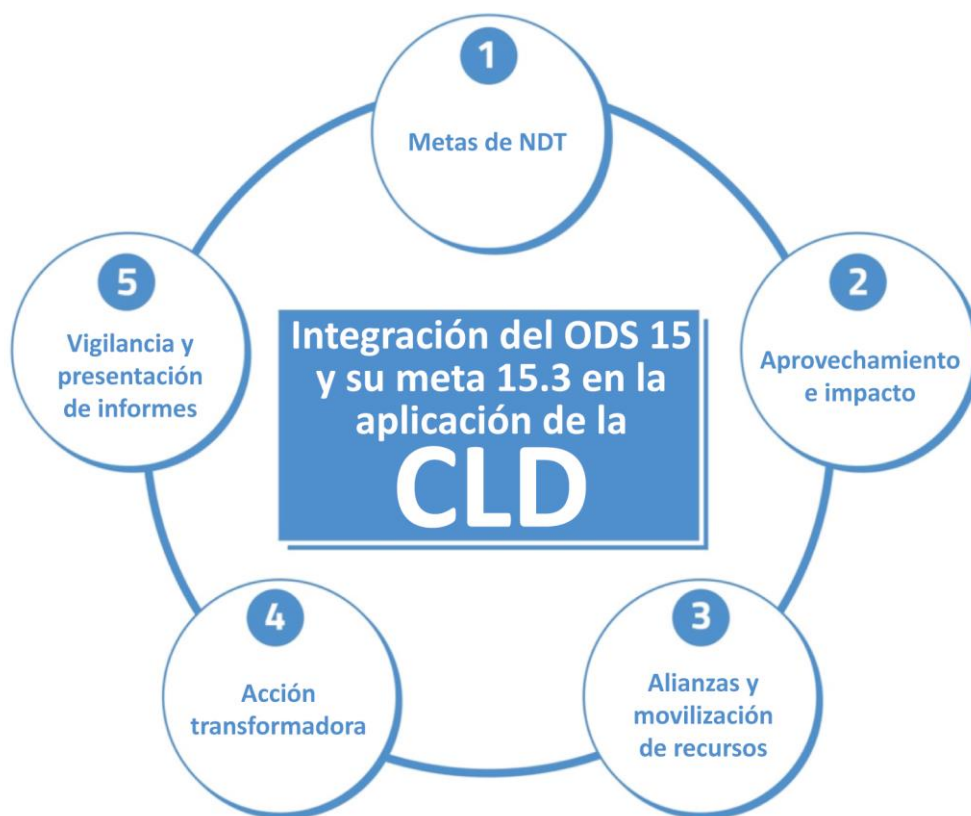
Gráfico 1 Los cinco elementos de integración