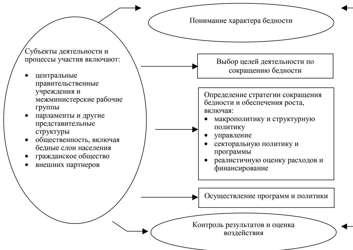
Диаграмма 1. Возможный подход к развертыванию стратегии сокращения бедности на уровне страны